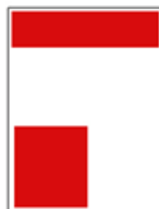
1/4 page bandeau : H 45 x L 128 mm H 90 x L 60 mm

Si vous souhaitez prendre un espace publicitaire ou y mettre votre logo :