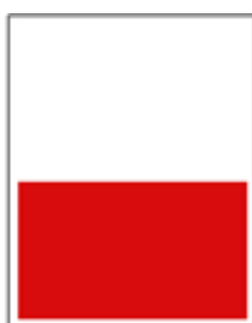
1/2 page L 128 x H 90 mm